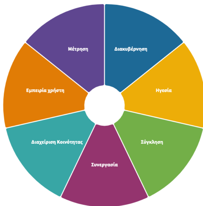
Εικόνα 3: Βασικά στοιχεία μιας Κοινότητας Πρακτικής

Το εγχειρίδιο The Communities of Practice Playbook 10 παρέχει μια επισκόπηση (Εικόνα 3 11 ) όλων των απαραίτητων στοιχείων για τη σχεδίαση του οδικού χάρτη της κοινότητάς του. Βοηθά στην ανάπτυξη κοινοτήτων, δικτύων και άλλων επίσημων ή ανεπίσημων δομών που απαιτούν συνεργασία και συνεννόηση μεταξύ διαφόρων ενδιαφερομένων που πρέπει να συνεργαστούν με κοινό σκοπό και όραμα.